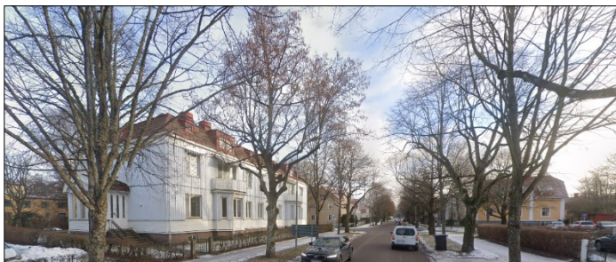
Figur 1 Orren 5 till vänster intill kulturmiljö Sörhaga.

Tjänsteställe: Samhällsbyggnadsförvaltningen, Bygglovsenheten Handläggare: Thang Hlawn Ceu Remitterad: Linda Lökvist Datum: 2025-09-24 Diarienummer: LOV 2025-394