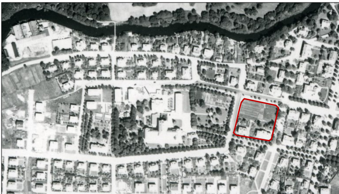
Figur 3 längst ner Här syns byggnaden på Orren 5, som då bara hade två byggnader. Idag finns inte byggnaden vänster – i dess ställe finns idag en parkeringsplats.