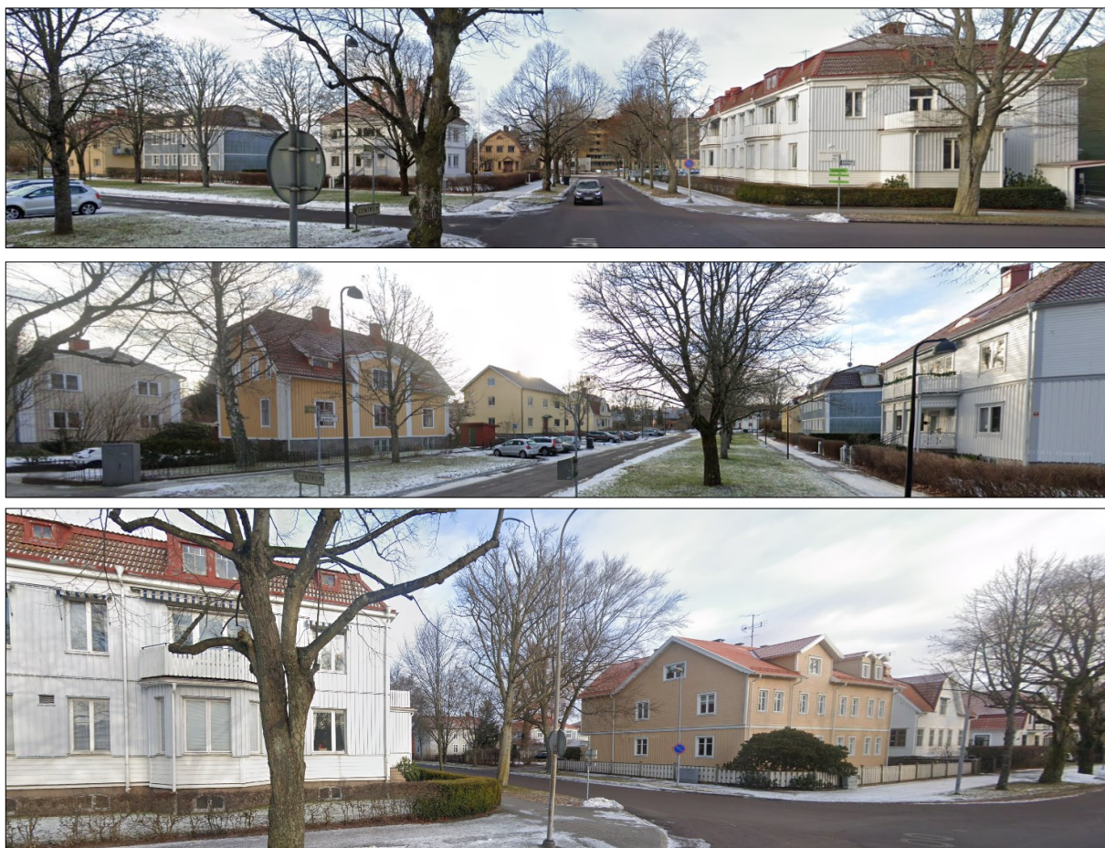
Figur 8-10 Miljöbilder med Orren 5 till höger i figur 3 och till vänster i figur 5.

De kulturhistoriska värdena kan beskrivas enligt följande: