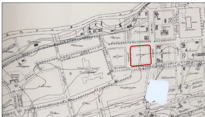
Figur 2 ovan Albert Lilienbergs stadsplan från 1909 med lasarettets huvudbyggnad i mitten, och kvarteret Orren öster om denna (inom röd gränslinje).

Stadsdelen Sörhaga planlades 1909 (stadfäst 2011) som trädgårdsstad av den kände stadsplaneraren Albert Lilienberg. I mitten av stadsdelen ligger stadens lasarett, omgivet av villakvarter. Under denna period blev stadsplaneringen en mer medveten strategi för att organisera stadens olika funktioner såsom olika former av bostäder, samhällsverksamheter och industriområden. Kännetecknande för trädgårdsstaden var bebyggelsens anpassning till omgivande terräng, gärna med svängda former. Det var Lilienberg som under denna tid införde trädgårdsstaden som stadsplaneideal i Sverige, och den blev också hans signum. Exempel på andra av hans stadsplanerade villastäder är bland andra Örgryte, Kungsladugård, Änggården och Landala egnahemsområde i Göteborg, varav de tre senare är utpekade som riksintresse för kulturmiljövården. Lilienberg blev också internationellt uppmärksam på en stadsplaneutställning för stadsplanen i Bagaregården i Göteborg.